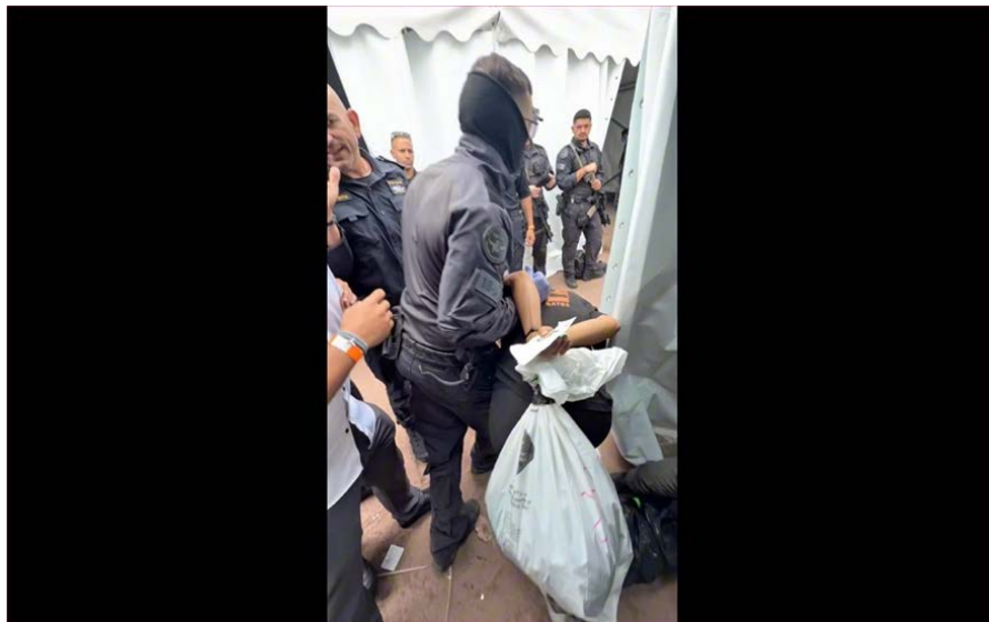
«Die Hände auf dem Rücken verdreht, den Kopf im Neunzig-Grad-Winkel nach unten gedrückt. Zu keinem Zeitpunkt hatte ich Zugang zu einem Anwalt.»

Muslimische Frauen waren am schlimmsten dran, sagte man mir später. Wir hatten einen Mann aus Malaysia an Bord. Die haben sie länger festgehalten und härter geschlagen als uns anderen. Das war ein Muster: Menschen aus bestimmten Ländern wurden systematisch härter behandelt.