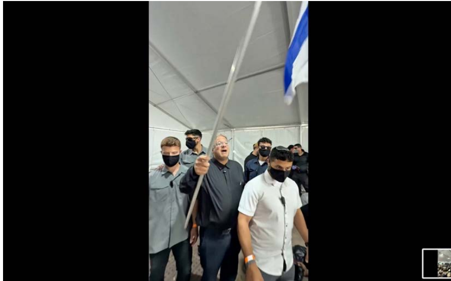
«Wir sind hier die Herren»: Der rechtsextreme Sicherheitsminister Itamar Ben-Gvir schwenkt die Fahne Israels über den am Boden knienden, mit Kabelbindern gefesselten Aktivisten.