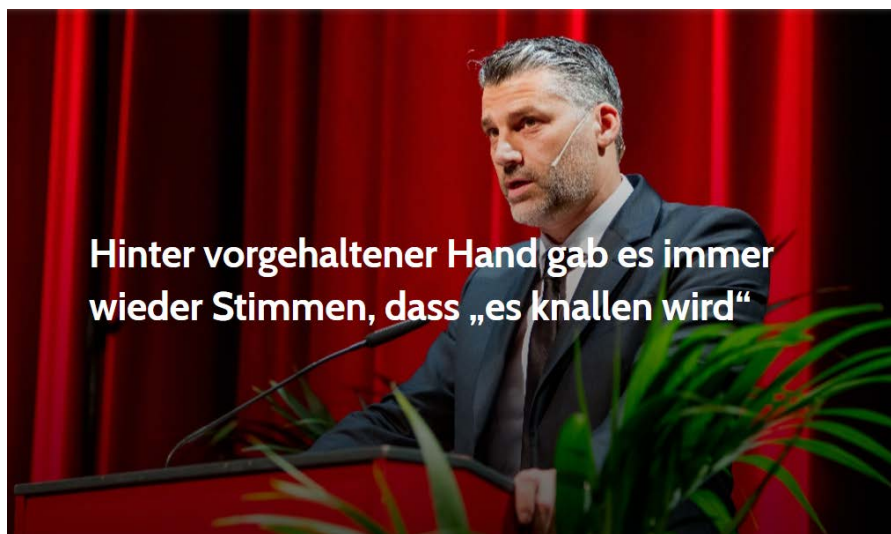
Ein Artikel von Marcus Klöckner; 12. August 2022 um 11:38

Quelle: https://www.nachdenkseiten.de/?p=86880