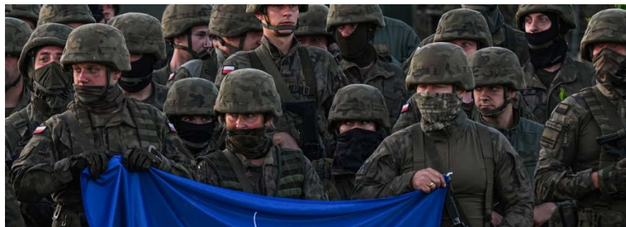
Polnische Soldaten halten eine NATO-Flagge während eines Familienfotos nach einer Trainingsdemonstration mit der multinationalen NATO-Kampfgruppe eFPon auf dem Truppenübungsplatz Orzysz am 3. Juli 2022 in Orzysz, Polen

Auf dem NATO-Gipfel hat sich das Bündnis strategisch neu aufgestellt. Damit wollen die USA ihre Hegemonie sichern und global ausweiten. Ein neuer Kalter Krieg und eine düstere Zukunft liegen vor uns.