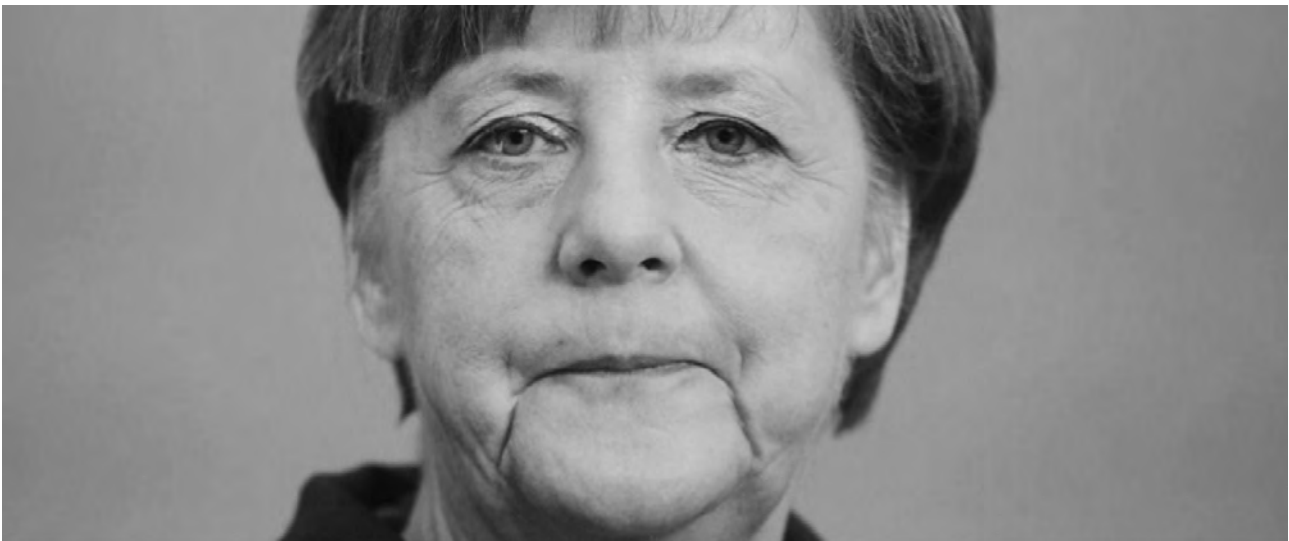
Angela Merkel bei Pressekonferenz in Mainz