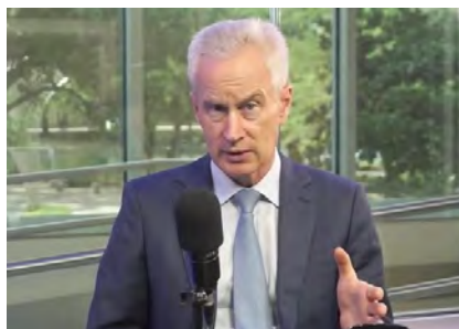
uncut-news.ch, November 23, 2021

Seit der Welle öffentlicher und privater COVID-19-Impfstoffverordnungen in diesem Sommer hat sich der Widerstand einer Öffentlichkeit, die weiss, dass die Verordnungen unethisch, unmoralisch und aus zivil-