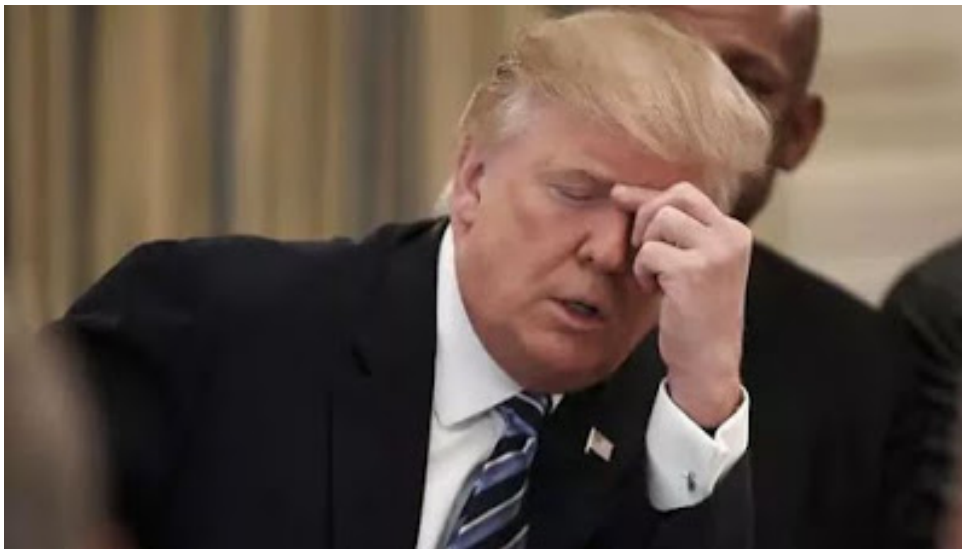
"Was hab ich nur für einen Scheiss gebaut!"

Das kommt davon, wenn man sich mit Kriegshetzern umgibt und auf sie hört. Zuerst haben die Iran-Hasser, die Trump beraten, ihn mit falschen Informationen dazu bewogen, General Qassam Suleimani zu ermorden, aber jetzt wo sie sehen, welchen Schaden sie aussen- und innenpolitisch damit angerichtet haben, lassen sie ihn im Regen stehen und stechen ihn in den Rücken. Trump darf jetzt alleine die Schuld für die krasse Fehlentscheidung auf sich nehmen und die Konsequenzen ausbaden.