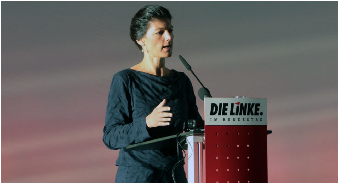
Sahra Wagenknecht (Archivbild)