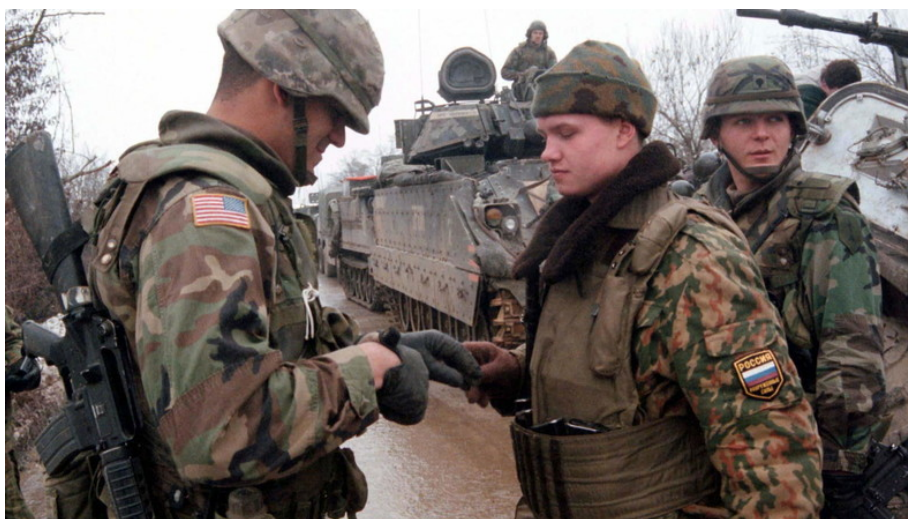
Mögen sich vielleicht lieber, als ihrer Führung lieb ist: Ein US-amerikanischer und ein russischer Soldat im Gespräch (Archivbild, Gajevi, Bosnien, 23. Januar 1997)

Pentagon zeigt sich alarmiert: Fast 50 Prozent der US-Soldaten betrachten Russland als Verbündeten