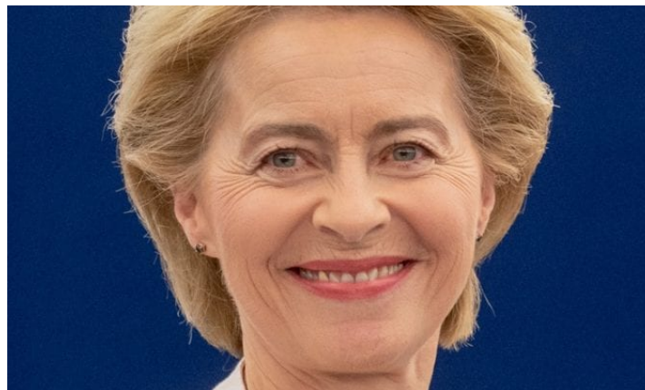
Ursula von der Leyen

Europäisches Parlament / Wikimedia (CC BY 4.0), 8. Dezember 2019 / 17:48