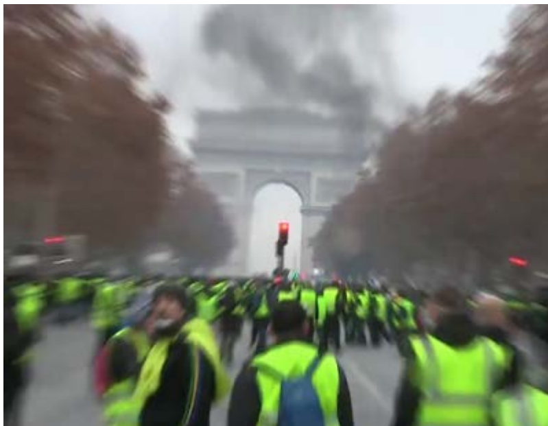
Als die Polizei sie mit Tränengas, Gummigeschossen und Wasserwerfern vom Versammlungspunkt am Arc de Triomphe de l'Étoile vertreiben wollte, versuchten einige mutige Demonstranten die vorrückende Polizei aufzuhalten, wie diese Frau ...