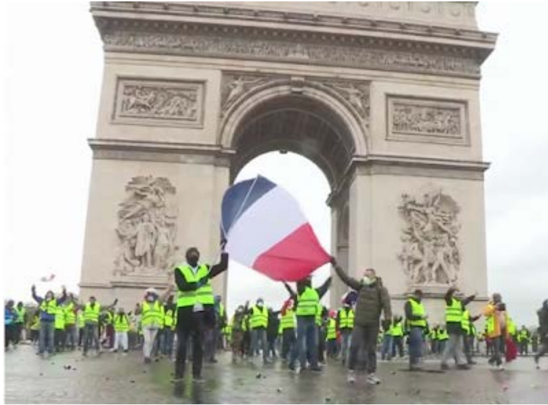
Zwischendurch sangen die Demonstranten immer wieder im Chor die französische Nationalhymne, La Marseillaise ...

Die Demonstranten riefen "Macron démission, Macron démission ... !!!"