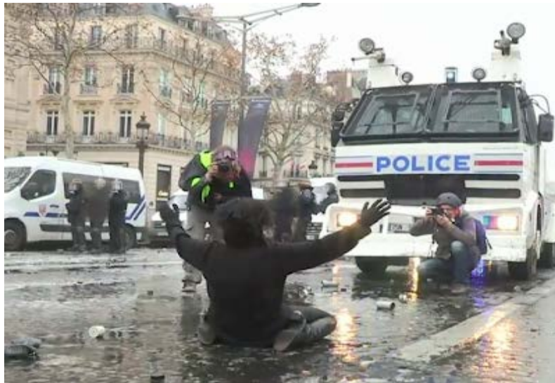
... die am Auge durch ein Polizei-Geschoss verletzt wurde: