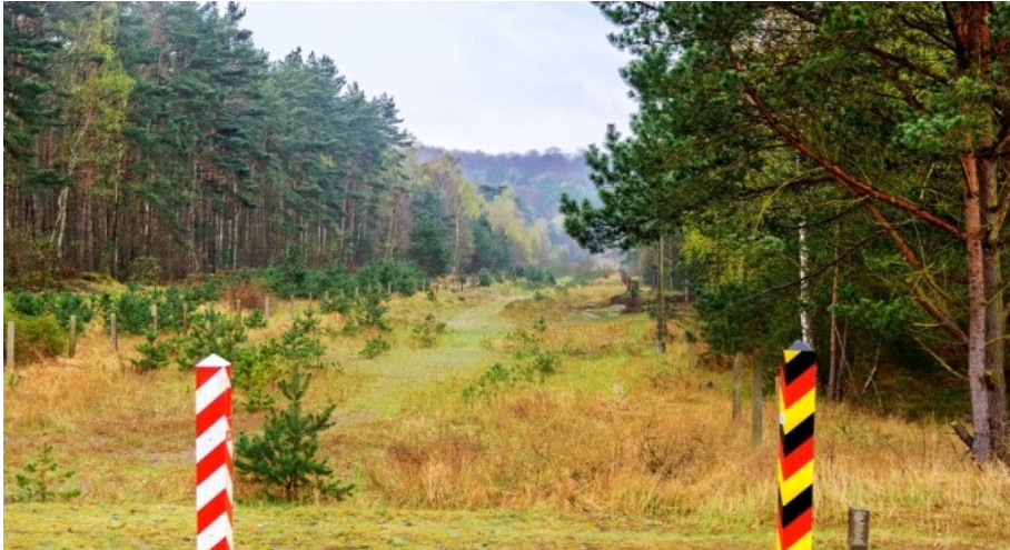
Grenze

Berlin – Mit aller Macht wollen die Grünen wieder die Grenzen öffnen, auf dass dieser Staat endgültig zu Bruch geht und diejenigen, die hier schon etwas länger leben, noch mehr zu leiden haben: Der Einsatz bayerischer Landespolizisten bei Kontrollen an der deutsch-österreichischen Grenze ist nach einem von den Grünen in Auftrag gegebenen Rechtsgutachten verfassungswidrig. „Der bayerische Grenzschutz verstößt nach seiner Konzeption im bayerischen Recht gegen das Grundgesetz“, schrieb die Grünen-Fraktionschefin Katrin Göring-Eckardt am Sonntag an Bundesinnenminister Horst Seehofer (CSU). Die Zusammenarbeit der Bundespolizei mit dem grundgesetzwidrig konzipierten bayerischen Grenzschutz müsse „eingestellt werden“, heißt es in dem Schreiben, über das die „Süddeutsche Zeitung“ (Montagsausgabe) berichtet.