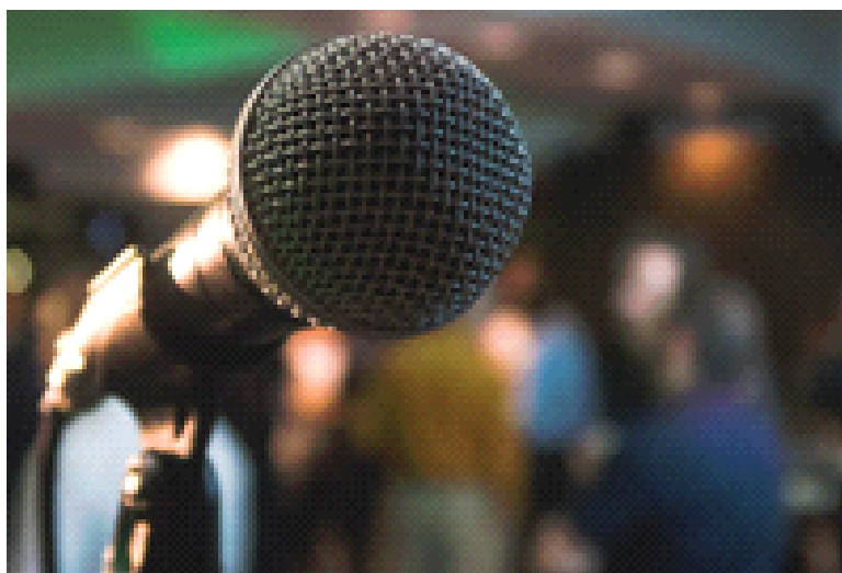
Lehrstück aus Deutschland

Was sich in Deutschland zusammenbraut, ist für alle Länder Europas besorgniserregend. Nicht nur, dass die Regierungs-Koalition dramatisch an Rückhalt verliert. Gefährlich ist, dass eine Diskussion zu politischen Meinungsverschiedenheiten kaum mehr stattfindet. Skrupellose Diffamierung, hemmungslose Anschwärzung der Wahlgewinner ersetzt jede demokratische Auseinandersetzung zu grundlegenden Problemen. Deutschland wird unberechenbar.