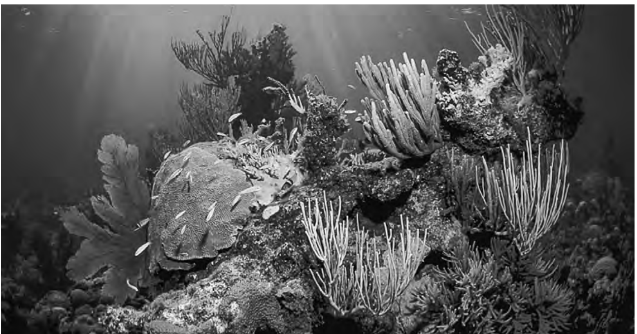
Ein tropisches Korallenriff.