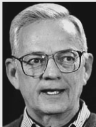
Ex-Minister O'Neill: "Nie einen Beweis gesehen"

Gut ein Jahr nachdem George W. Bush ihn gefeuert hat, bereitet der ehemalige US-Finanzminister Paul O'Neill seinem früheren Boss Ungemach. Der Präsident habe den Irak-Krieg bereits bei Amtsantritt geplant, behauptet O'Neill. Auch Warnungen seines Ministers vor einem Haushaltsdefizit soll Bush in den Wind geschlagen haben.