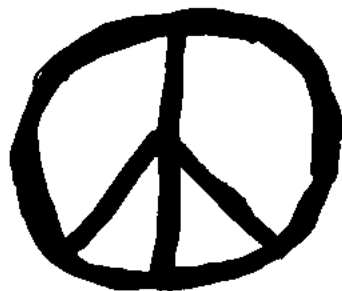
Todessymbol als falsches Friedenszeichen

Die sogenannte Friedens- und Hippie-Bewegung wurde von einem markanten Symbol begleitet. Einem Symbol, das angeblich für Frieden, Liebe und Harmonie stehen sollte. Es ist das Zeichen, das als PEACE-Symbol weltweite Bekanntheit erlangte. Millionenfach war es in allen möglichen Farben auf Transparenten, Fahnen, Schmuck, Kleidung, als Tattoos oder auf Plattenhüllen usw. zu sehen. Im Laufe der Jahre und mit dem Abklingen der Hippie- und Friedens-Bewegung verschwand allmählich auch wieder das Peace-Symbol. In neuerer Zeit wurde und wird es aber wieder aus der Versenkung hervorgeholt und ist vermehrt anzutreffen. Auf der Webseite HYPERLINK <http://www.hippie.ch> wird es unverkennbar mit den Hippies in Verbindung gebracht. Zur Zeit ist es auch allgegenwärtig auf den Gesichtern von Antikriegsdemonstranten/-innen. Im TV ist es auch als Ersatz für das <Viva>-Logo aktuell.