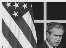
US-Präsident Bush: Seit wann plante er den Irak-Krieg?

Nun hat O'Neill sein Schweigen gebrochen. Als Hauptquelle für ein brisantes Enthüllungsbuch, das jetzt erscheint - flankiert von Interviews, erst mit dem TV-Sender CBS, dann mit dem Nachrichtenmagazin "Time" - rechnet er mit seinem alten Dienstherrn ab.