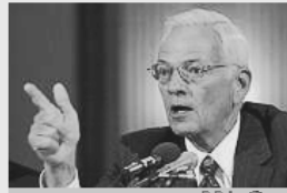
Schwere Vorwürfe gegen Bush: Ex-Minister O'Neill

New York - Der erste Schock kam bereits zehn Tage nach der Vereidigung des Präsidenten. Am 30. Januar 2001 beruft George W. Bush erstmals seinen Nationalen Sicherheitsrat ein. Der überraschende "Tagesordnungspunkt A" der erlauchten Runde: Kriegspläne nach Sturz des irakischen Diktators Saddam Hussein.