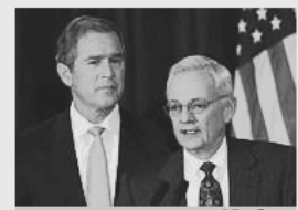
Eisiges Verhältnis: Bush und O'Neill (Archivfoto vom Dezember 2000)

Doch Bush habe das Thema zwei Tage später, auf der nächsten Sitzung des Sicherheitsrats, weiter vorangetrieben. Autor Suskind skizziert in seinem Buch den frühen Aufmarsch Bushs für den Irak-Krieg - bereits im Januar und Februar 2001: "Es gibt Memos. Eins davon, 'geheim' gestempelt, lautet: 'Plan für den Irak nach Saddam.'" In weiteren Exposé vorbereitete sich das Weiße Haus demnach schon damals auch auf den Nachkriegseinsatz von Friedenstruppen und Kriegsverbrechertribunalen vor - sowie die Aufteilung des irakischen Öls. Ein Pentagon-Dokument ("Ausländische Bewerber um irakische Ölfeld-Verträge"), datiert vom 5. März 2001, habe eine Landkarte mit potenziellen Ausbeutungsfeldern beinhaltet.