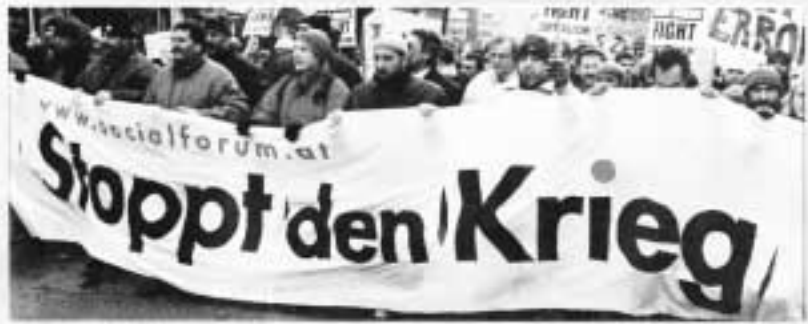
Der Pensionist, Wien, Nr. 2/2003

Die Drohungen der US-Regierung gegen die UNO sowie Druck und Erpressung gegenüber der internationalen Staatengemeinschaft müssen entschieden zurückgewiesen werden, und die österreichische Regierung ist aufgefordert, nicht derart lendenlahme Erklärungen abzugeben wie es Frau Ferrero-Waldner in der EU-Kommission tat. Als neutraler Staat brauchen wir eine Erklärung, die klar und deutlich den Wunsch nach Frieden ausdrückt. Das haben die Antikriegs-Demonstrationen auf der ganzen Welt und auch in Österreich gezeigt. Daher ist die Losung unseres Bundestages „Für Frieden, Neutralität und soziale Sicherheit“ in der heutigen Zeit aktueller denn je.