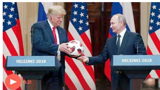
Putin übergab Trump den WM-Fussball und sagte: «Jetzt ist der Ball auf seiner Seite»

Das lang erwartete Gipfeltreffen zwischen Trump und Putin ist in Helsinki mit einer Pressekonferenz der beiden Präsidenten zu Ende gegangen.