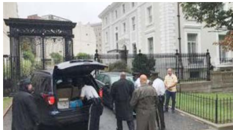
FBI-Agenten vor der russischen Handelsmission in Washington

Gegen jedes internationale Recht ins russische Hoheitsgebiet eindringen und Vertretungen durchsuchen. Ja, das ist heutzutage genau die nächste illegale und unverschämte Vorgehensweise Washingtons und damit Brücken abbrechen, keine Dialoge mehr führen, nicht mehr miteinander reden. Das trägt sicher zu einem besseren gegenseitigen Verständnis und schlussendlich zu einer Lösung der weltweiten Konflikte bei. Nach der Verschärfung der Sanktionen ist es der nächste provokante Schritt zu einem Krieg zwischen den Vereinigten Staaten und der Russischen Föderation. Trump ist ausgeschaltet und der «Tiefe Staat» hat seine Macht demonstriert.