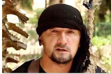
Gulmurod Khalimov, der ISIS-Mann des Pentagons in Syrien, oder Russland, oder wo immer sie ihn hin verpflanzen

tung dieses brutalen Killers, der für so viele Opfer in Syrien und Frankreich verantwortlich ist, beim US-State-Department und der französischen Regierung dazu führen würde, dass sie ihre lächerliche Anti-Russland-Ideologie aufgeben und in einer öffentlichen Stellungnahme Glückwünsche an das russische und syrische Militär für diese bewundernswerte Leistung aussprechen würden. Aber da lägen wir falsch. Sie sagen rein gar nichts! Tatsächlich haben sie wahrscheinlich grosse Schwierigkeiten, ihren Drang zu kontrollieren, Russland einen blutigen Mörder zu nennen, da es gerade einige ihrer Lieblings-Agenten umgebracht hat.