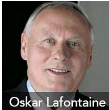
Von Oskar Lafontaine.

Trump gegeben, weil der Multimilliardär nicht auf die Spenden der Wall Street angewiesen ist und darum keine Anweisungen von ihr entgegennehmen muss. Dass Trump jetzt allerdings eine Politik für die Ärmeren und Benachteiligten macht, erwarten wohl nicht einmal viele seiner Wähler.