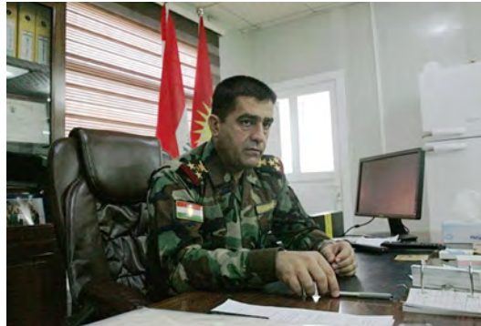
Brigadegeneral Hazhar Omar Ismail in seinem Büro im Peshmerga-Ministerium der kurdischen Regionalregierung in Erbil

Brigadegeneral Hazhar Omar Ismail, Director of Coordination and Relations am Ministry of Peshmerga Affairs, ist der erste in den USA ausgebildete kurdische Offizier. 2013 machte er seinen Abschluss am Pennsylvania Military College. Er empfängt uns in seinem Büro im Ministerium der Peshmerga. Das Gebäude darf von aussen nicht fotografiert werden und ist auch auf Google Maps nicht zu finden. Wir werden trotzdem freundlich empfangen und dürfen dem General, beim obligatorischen Schwarztee, unsere Fragen zur aktuellen Lage in und um Mosul stellen.