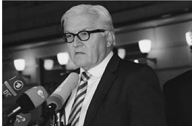
Steinmeier fordert Kooperation Suriens Armee und verfeindete Milizen sollen zusammen gegen IS kämpfen.

Saudi-Arabien ist ein «bad player» mit einer eigenen gegen den Iran gerichteten Agenda. Er unterstützt indirekt den IS und kämpft zugleich aus der Luft gegen ihn. Leider brauchen wir Saudi-Arabien zwingend wegen seiner militärischen Stärke für einen Kampf am Boden, so wie wir in dieser Phase auch Assad akzeptieren müssen. Nach der Vernichtung des IS müssen die gesamte Region neu geordnet und unsere (Rüstungs-)Beziehungen überprüft werden.