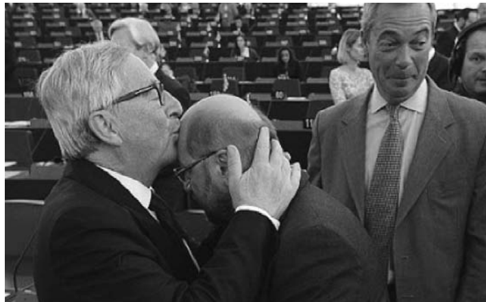
Juncker war wohl wieder besoffen, denn er hat Schulz auf die Glatze geküsst. Das Gesicht von Nigel Farage sagt alles.

Die Eurotanic hat den Eisberg gerammt, ist tödlich leckgeschlagen, das Schiff läuft voller Wasser, der Bug ist schon überflutet, aber die unfähigen Kapitäne in Brüssel, Paris und Berlin tun immer noch so, wie wenn alles in Ordnung wäre. Die meisten Passagiere glauben den Lügen über die Unsinkbarkeit, feiern noch die Party der unbezahlbaren Rundumversorgung, lassen sich unterhalten, ignorieren die Schräglage, dabei ist das Ende unausweichlich.