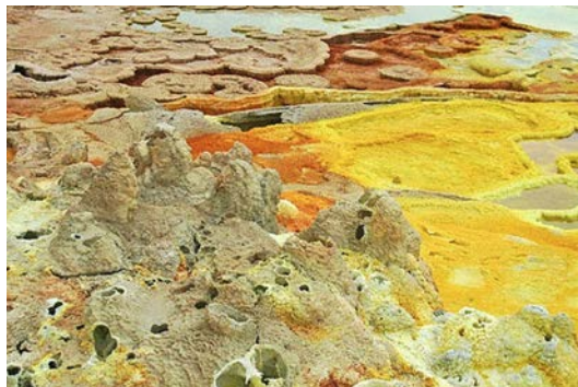
Heisse Quellen in der Danakilsenke.

Andreas Müller; Grenzwissenschaft aktuell; Mi, 16 Aug 2017 19:14 UTC