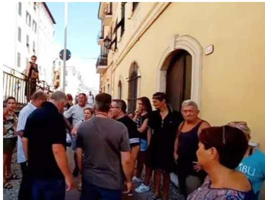
In Italien fliegt bald der «Migrantenkessel» in die Luft

Die Stimmung kippt, immer mehr Bürger in Italien haben die Schnauze voll von der unverantwortlichen Migrantenpolitik der Regierung. In der kleinen norditalienischen Stadt Ventimiglia gehen die Anwohner auf die Strasse: «Schluss mit den Migranten. Wir können nicht mehr!»