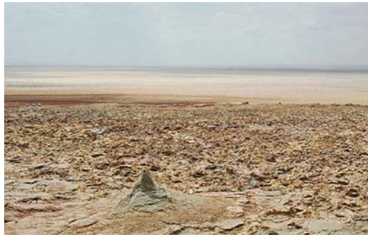
Blick auf die Dankil-Salztonebene

Das Wasser in einem der Säuretümpel erreicht einen Rekord-pH-Wert von nahezu Null und ist damit der säurehaltigste Ort auf der Erde, an bzw. in dem bislang Leben gefunden wurde.