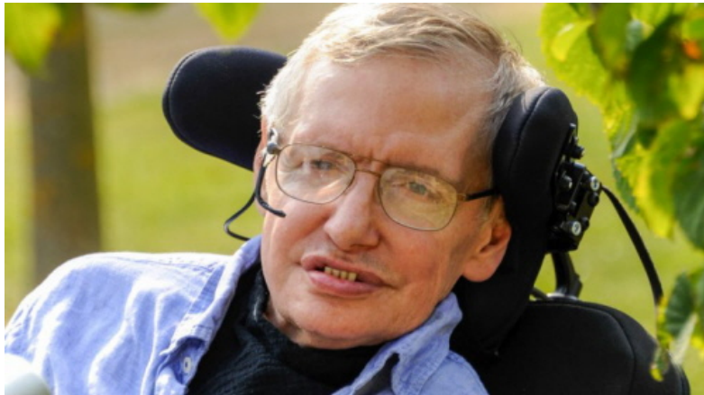
Stephen Hawking, physicist (1942–2018)

„Unser Planet und die Menschheit stehen vor vielfältigen Herausforderungen. Diese Herausforderungen sind global und ernst – Klimawandel, Nahrungsmittelproduktion, Überbevölkerung, Dezimierung anderer Arten, Epidemien, Versauerung der Ozeane.“