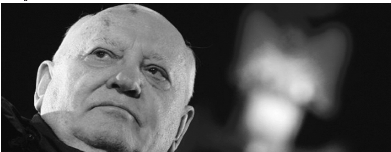
Michail Gorbatschow bei der Gedenkfeier zu 25 Jahren Mauerfall