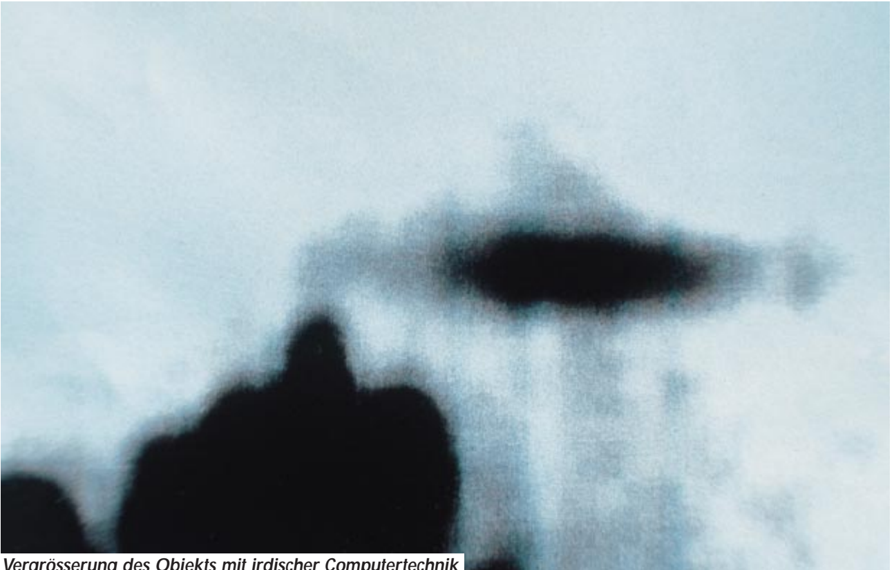
Vergrosserung des Objekts mit irdischer Computertechnik