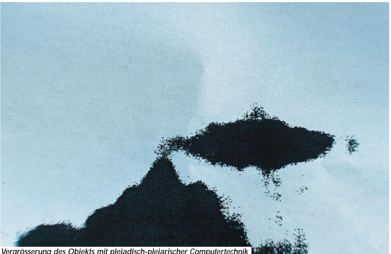
Vergrosserung des Objekts mit plejadisch-plejarischer Computertechnik

Bei dem am 9. Mai 1998 photographierten Objekt handelt es sich – wie eine Rückfrage bei den Plejadiern/ Plejaren ergab – tatsächlich um ein Strahlschiff, das der plejadisch-plejarischen Föderation angehörte und mit Ptaah und Florena im Einsatz stand. Dazu erklärte Florena folgendes, nachdem sie gemäss ihren Möglichkeiten und nach zweistündiger Arbeit das Film-Negativ untersucht hatte: